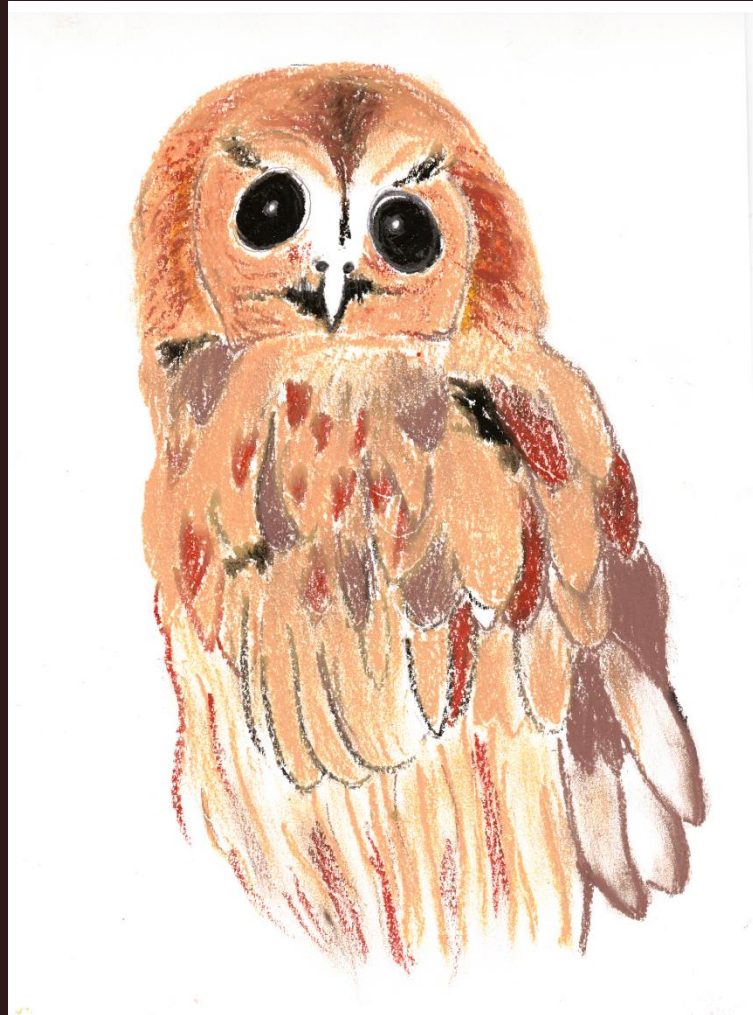
Illustration du livre