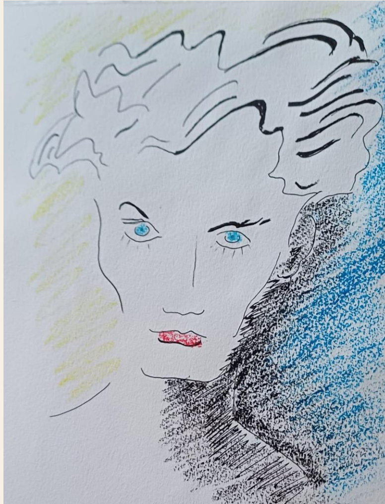
Illustration du livre